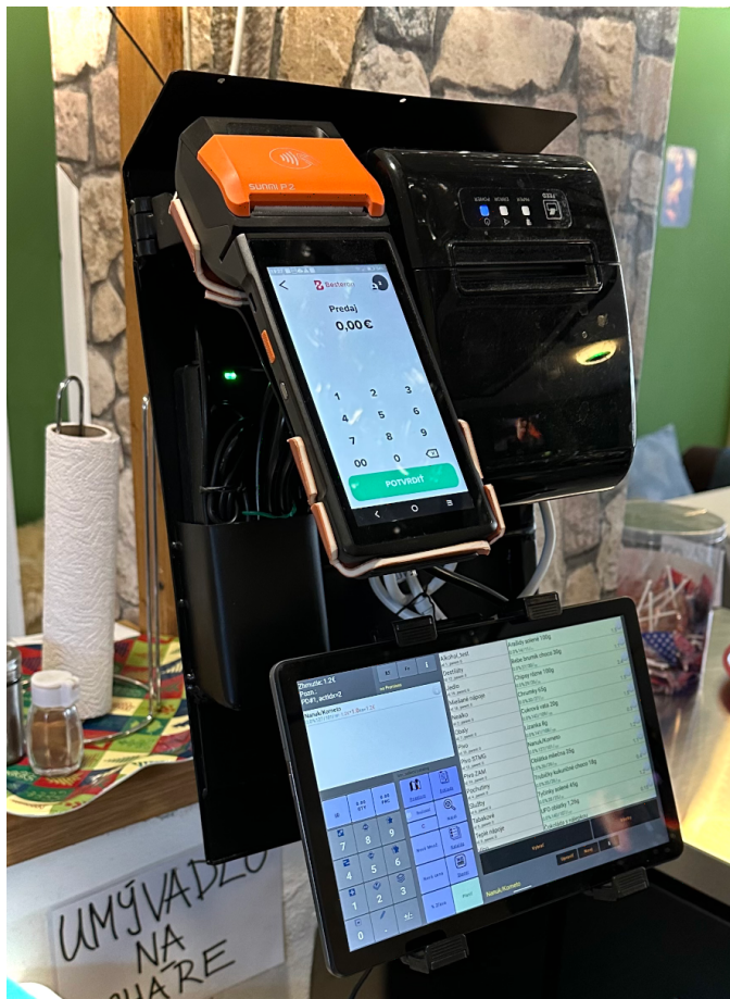
Pohľad zo strany personálu.